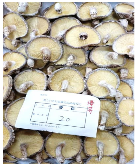
袋物の部 香信優等（林野庁長官賞）