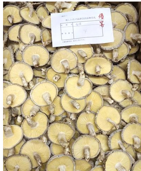
箱物の部 香信優等（宮経椎茸会長賞）