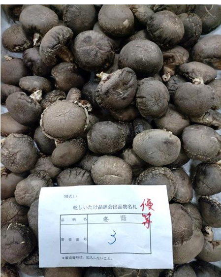
袋物の部 冬菇優等（林野庁長官賞）