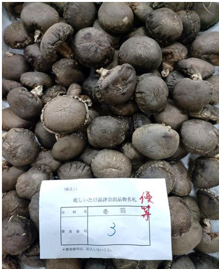
袋物の部 冬菇優等（県知事賞）