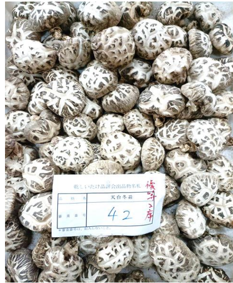
袋物の部 天白冬菇優等二席（県知事賞）