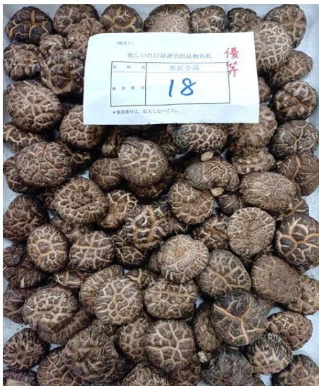
袋物の部 茶花冬菇優等（議員連盟会長賞）