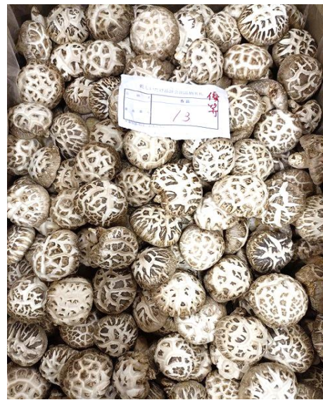
箱物の部 香菇優等（林野庁長官賞）