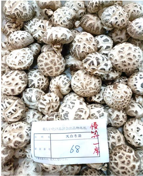
袋物の部 天白冬菇優等一席（林野庁長官賞）