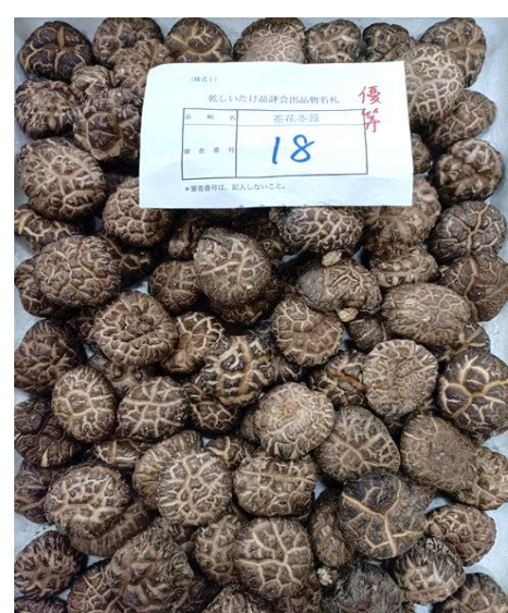
袋物の部 茶花冬菇優等（林野庁長官賞）