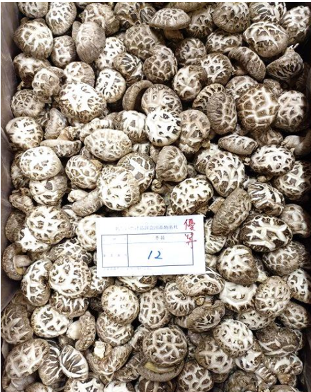
箱物の部 冬菇優等（林野庁長官賞）