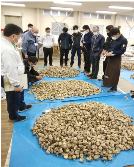
箱物審査のようす

令和4年4月13日に箱物・袋物両部門において審査員11名により厳正に審査を実施した。