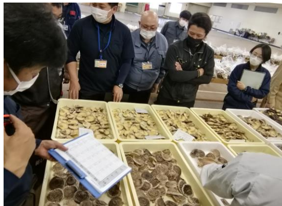
袋物審査のようす