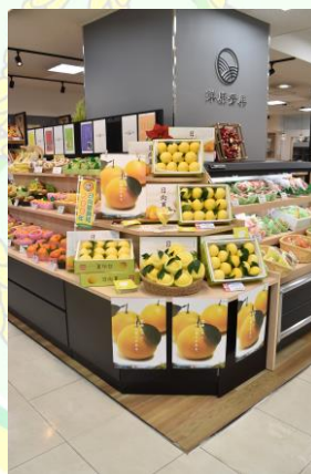
▲洋康青果様での販売の様子