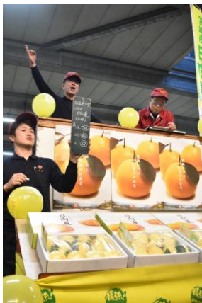
▲過去の市場解禁PRの様子

下記の通り、販売解禁PRを実施致します。 取材の際は、新型コロナウイルス感染拡大防止の徹底をよろしくお願い致します。